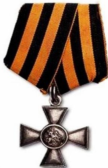
Орден Святого Георгия с Георгиевской лентой (Российская империя)

Исторически «Георгиевская ленточка» является наследницей Георгиевской ленты - двухцветной ленты к ордену Святого Георгия, Георгиевскому кресту или Георгиевской медали, которые служили военными наградами в Российской Империи.